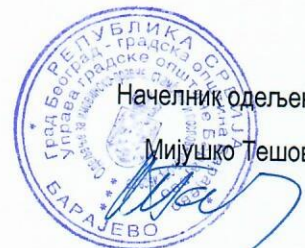
Начелник одељења, Мијушко Тешовић