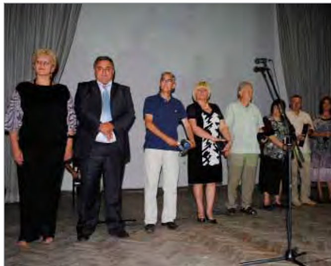
Добитници општинских признања

Славског колача, док је пригодан програм академије одржан у великој сали Дома културе.