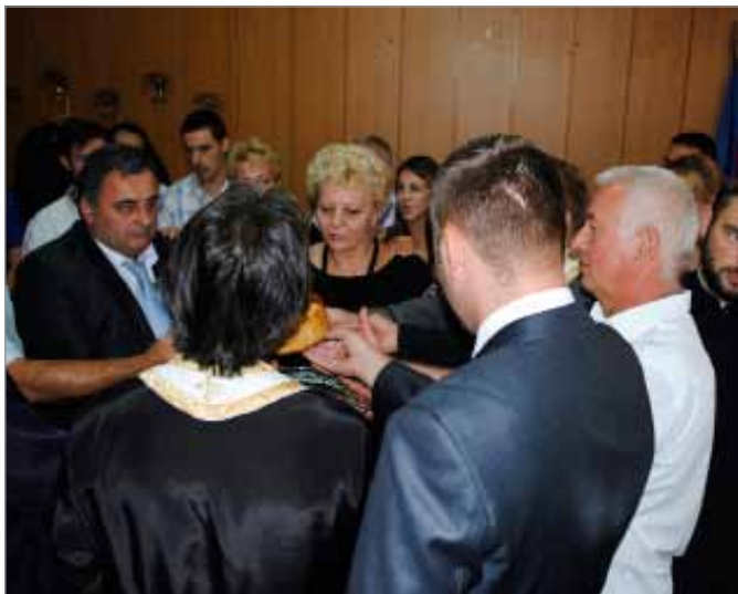
Ломљење славског колача