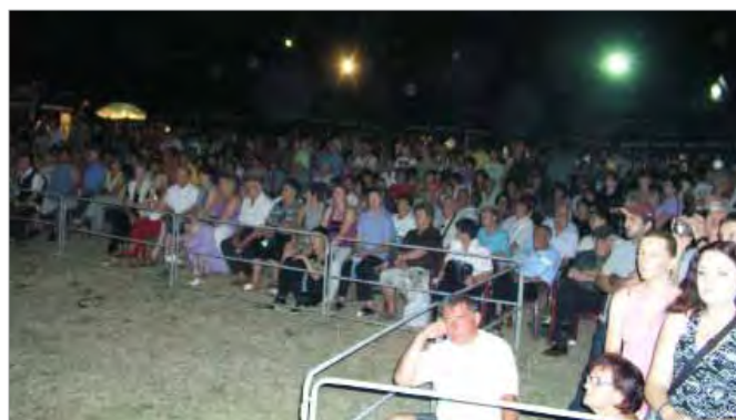
Велико интересовање за фестивал у Гунцатима