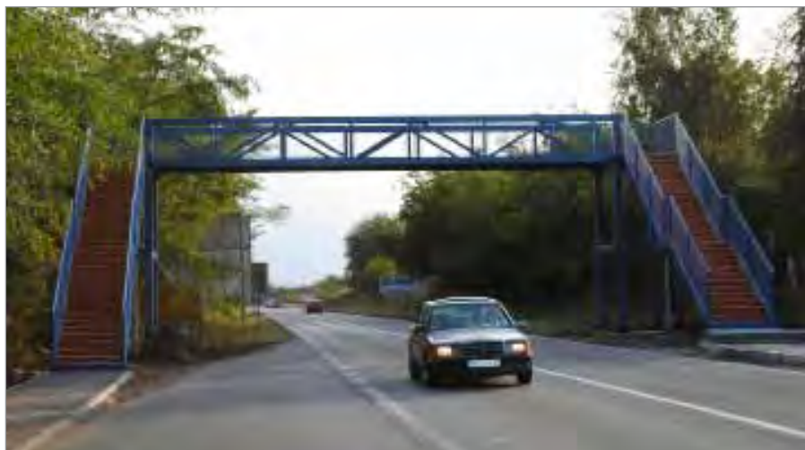
Пасарела на магистрали код скретања за Рипањ значајно допринела већој безбедности у саобраћају

– Ми смо пре само два и по месеца започели израду пројектне документације. Имали смо веома рационалан приступ у изради ових пасарела, како би трошкови били мањи. Ово ће бити потпуно легално пројектовани и изграђени објекти за мање од три месеца. Према његовим речима, на магистралним и регионалним путевима у околини Београда ће до краја