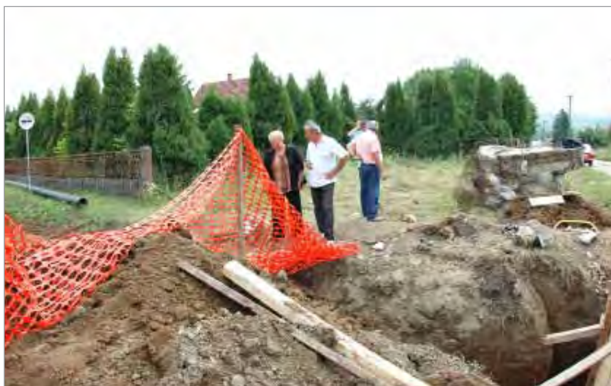
Изградња водовода први приоритет општинског руководства

Када буде завршена изградња главног цевовода, на мрежу ће прво бити повезани најважнији објекти у центру Бељине, као што су школа, дом здравља и дом културе, а у центру насеља, испред порте цркве, биће постављена јавна чесма коју ће моћи да користе сви грађани док се не заврше неопходни радови на изградњи секундарне мреже, чиме ће се створити услови за прикључење свих домаћинстава на водоводну мрежу.