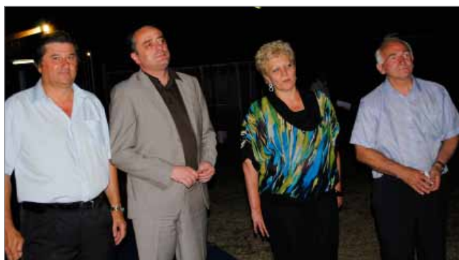
Са свечаног отварања манифестације