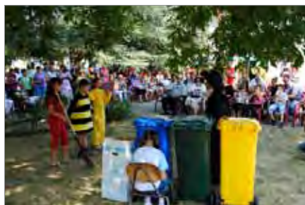
Детаљ из представе "Зелено отрежњење"

Зелена представа „Еколошко отрежњење“ имала је за циљ да утиче на свест свих присутних да у будућности воде више рачуна о животној средини. Певање „Рођенданске песме“ уз гашење свећица