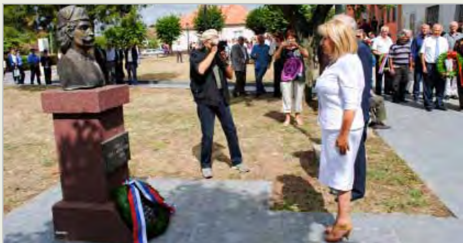
Обележена 207. годишњица оснивања Правитељствујушћег совјета српског

У ОВОМ БРОЈУ СПЦИЈАЛАН ДОДАТАК: КАКО ДО ЛОКАЦИЈСКЕ, ГРАЂЕВИНСКЕ И УПОТРЕБНЕ ДОЗВОЛЕ