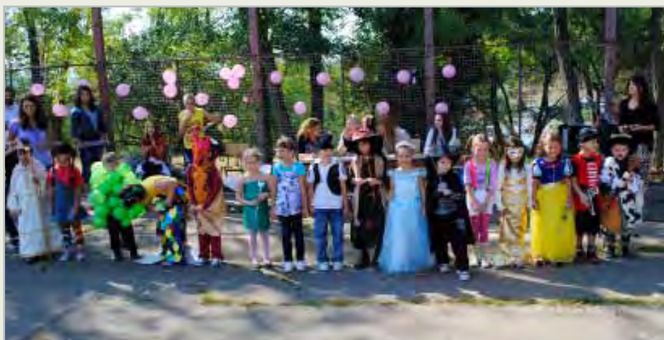
Растемо као једно – бољи смо заједно