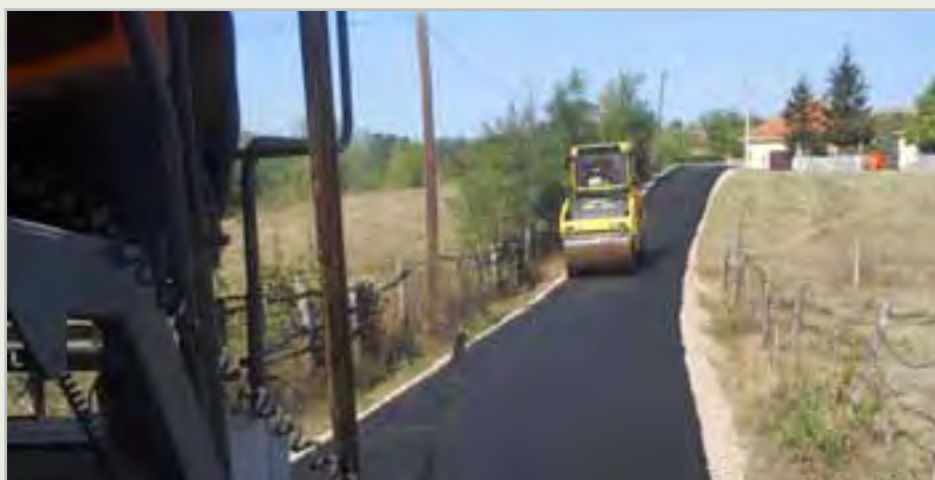
У 2013. асфалт за 35 улица