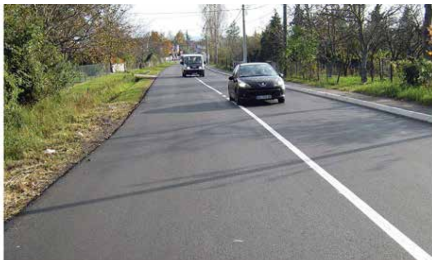
Пут Барајево-Липовица после асфалтирања

блема. У току су радови на изградњи водоводне мреже у Лисовићу и Бељини, а очекујемо да ускоро почну и радови који ће обезбедити водоснабдевање и преосталих месних заједница Манића, Рожанаца и Арнајева. Такође је у току израда пројектне документације за изградњу централног система за пречишћавање отпадних вода, чиме се ствара могућност изградње канализације на целом подручју општине.