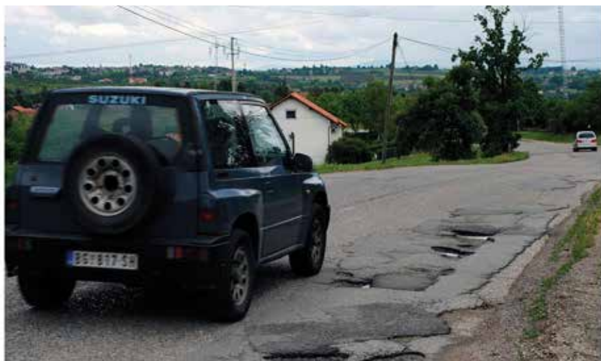
Пут Барајево-Липовица пре реконструкције