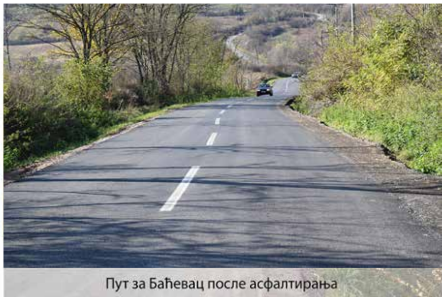
Пут за Баћевац после асфалтирања

али свакако пројеката који мењају слику о Барајеву и показују да се ствари могу мењати само уколико се то хоће и уколико се то жели. Овде пре свега мислим на реконструкцију степеништа на Мађарском брду у