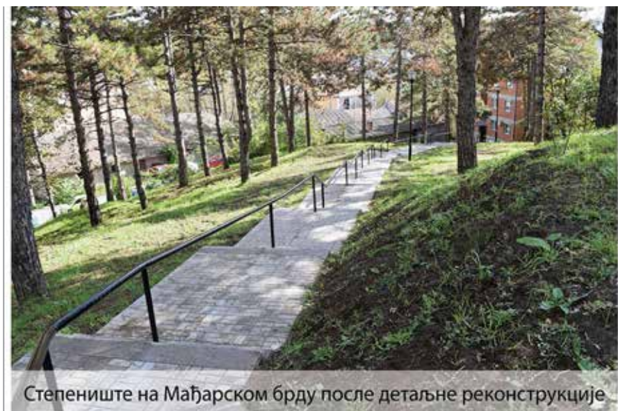
Степениште на Мађарском брду после детаљне реконструкције

у плану је изградња постројења за пречишћавање отпадних вода из Насеља Гај, завршетак шеталишта поред Барајевске реке.