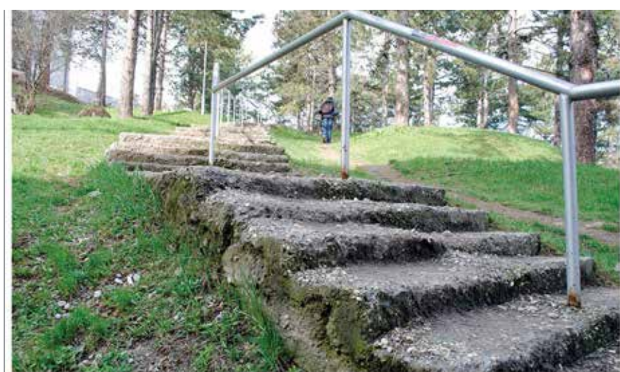
Степениште је било готово неупотребљиво