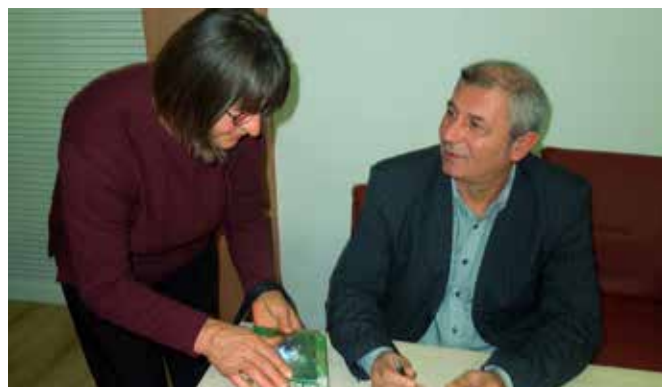
Са промоције књиге „Српско срце Јоханово“