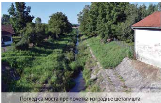
Поглед са моста пре почетка изградње шеталишта

У 2017. Годину улазимо са пуно више оптимизма. Остварили смо добру сарадњу са градом Београдом. Од Града очекујемо знато већа средства за асфалтирање локалних улица и путева. Имамо велике количине рециклираног асфалта и камена који смо добили од Железница Србије па нас чека интензивна активност на уређењу већег броја некатегорисаних путева, почећемо и са уређењем тротоара у центру Барајева, али и на другим локацијама, посебно тамо где је угрожена безбедност ђака. Наставиће се изградња водовода,