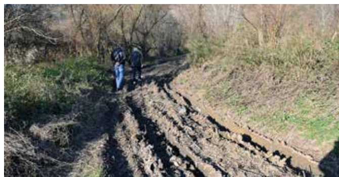
Пут пре поправке