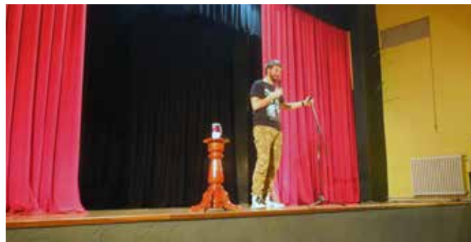
„Ђаво из јагоде“