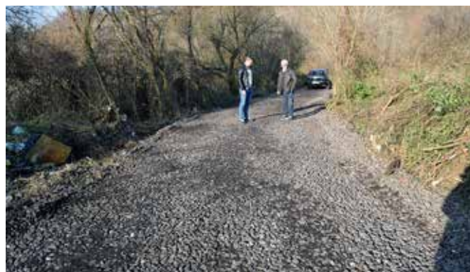
Пут после насипања каменом

Раднике ЈКП „10. октобар“ затекли смо како овим каменом насипају крак улице Миодрага Вуковића (код штала) који ће омогућити грађанима који имају куће и земљиште преко реке Барајевице да и колима стигну до својих имања.