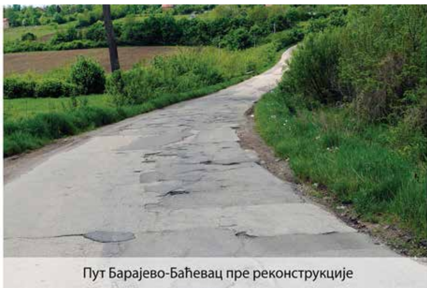
Пут Барајево-Баћевац пре реконструкције