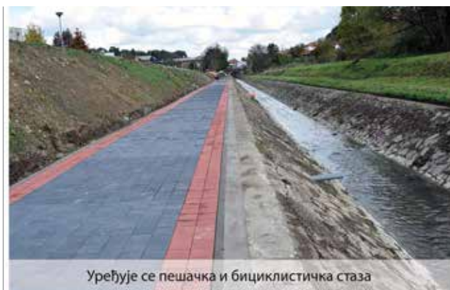
Уређује се пешачка и бицикличка стаза