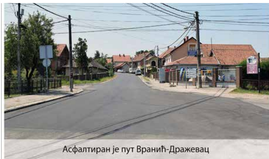
Асфалтиран је пут Вранић-Дражевац

Град Београд улаже значајна средства у циљу решавања неких од најважнијих инфраструктурних про-