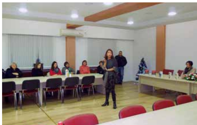
Са промоције књиге „Казна за грех“