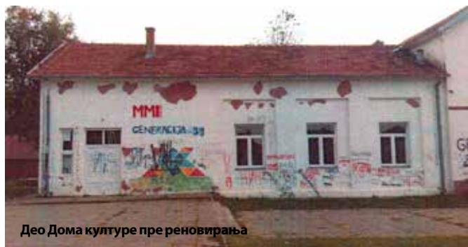
Део Дома културе пре реновирања

Продавница има 140 м 2 и налази се у склопу Дома културе у просторијама које су до недавно коришћене као школска физкултурна сала. Значајно је свакако поменути да отварањем ове продавнице запослено 10 нових радника из Вранића, а оплемењен је и простор испред продавнице, тако да су сви на добитку.