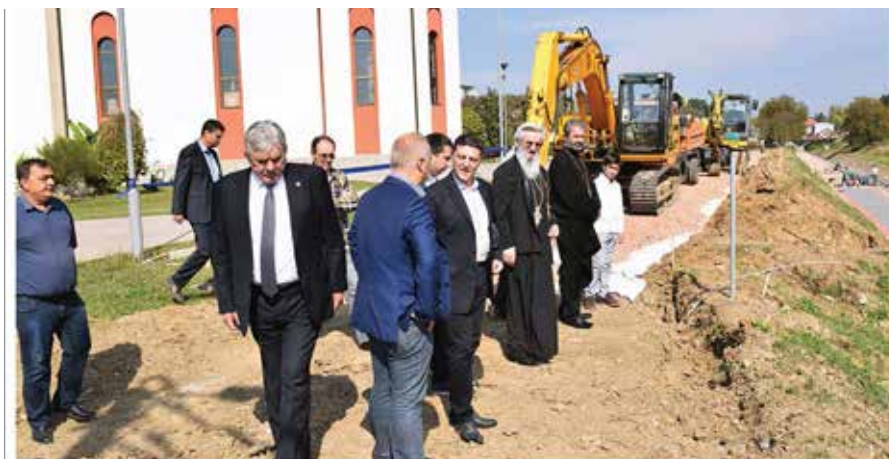
Велико интересовање и подршка за изградњу шеталишта