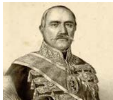
Књаз Милош Обреновић

По плану међународне православне револуционарно-ослободилачке орга-